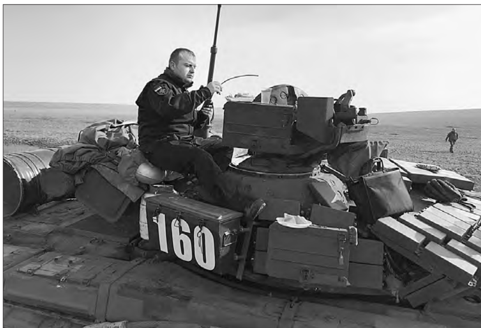
За тиждень після виходу з Маріуполя.

стояв на Волноваському напрямку. Десь о 21-ї години мені подзвонив командир бригади по закритому зв'язку: «У вас тривога по навчанню. Дійте за таким-то сигналом». За ним я повинен був вивести батальйон у запасний район. Підняв батальйон, вийшли, організували охорону, оборону, відпочинок, — розгорнули всі ці елементи. І чекали команди про закінчення базовий табір. Танки — це кіпіш, все гуде... Зібрав, дав команду, що повертаємося назад. Тут командир танка каже мені: «Там щось так спалахнуло! Чи вибух був, чи що». Обернувся, кажу: «Та тебе щось глючить». — «Ні, щось було!». Ми поїхали. Приїжджаємо в базовий табір, у нас все було спокійно. Свій танк загнав у